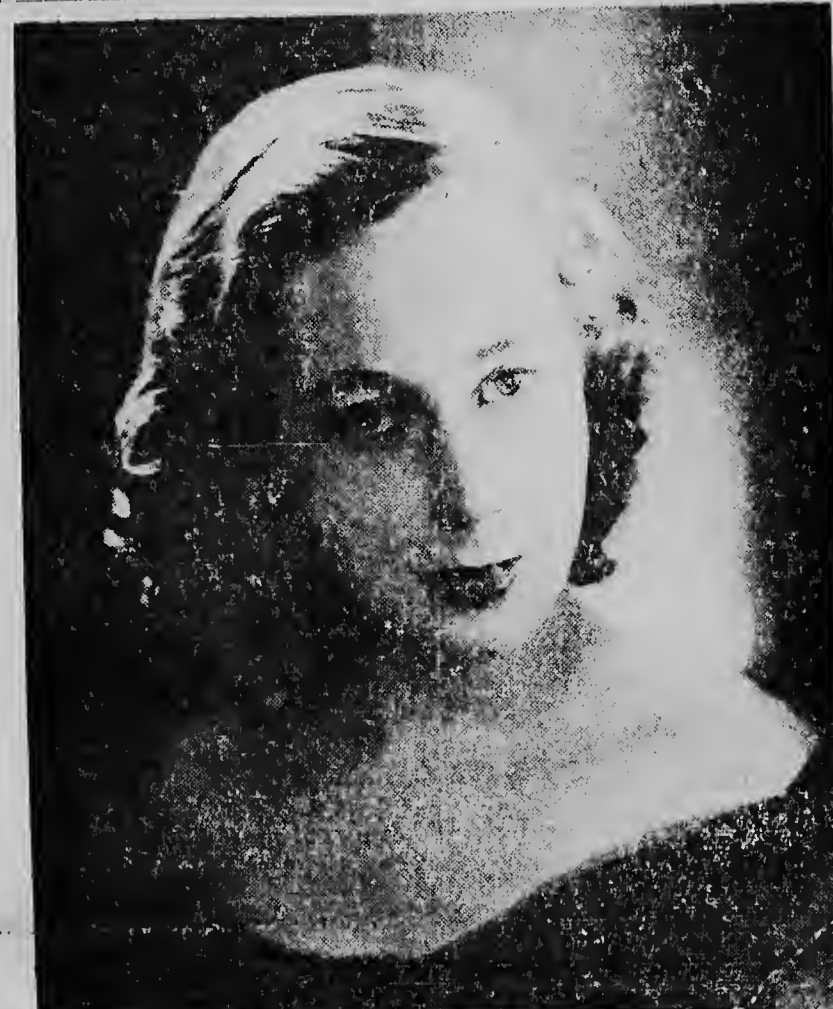
E pianista Tan Crone

Presidente Frondizi di Argentina a tene un discusion awe mainta cu ministro Dulles tocante problemanan economico y asuntunan, cu ta importante pa tur dos pais, e discusion a dura 50 minuut.